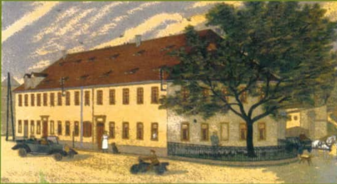
Das Pilzmuseum befindet sich im 1830 erbauten und wieder rekonstruierten Erbgericht zu Reinhardtsgrimma.